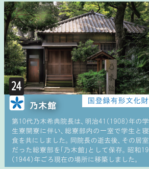
24 乃木館 国登録有形文化財 第10代乃木希典院長は、明治41(1908)年の学生寮開寮に伴い、総寮部内の一室で学生と糧食を共にしました。同院長の逝去後、その居室だった総寮部を「乃木館」として保存。昭和19(1944)年ごろ現在の場所に移築しました。