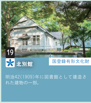
19 北別館 国登録有形文化財 明治42(1909)年に図書館として建造された建物の一部。