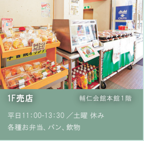
1F売店 輔仁会館本館1階 平日11:00-13:30 / 土曜 休み 各種お弁当、パン、飲料