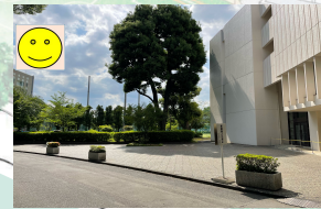
(団体見学)集合場所