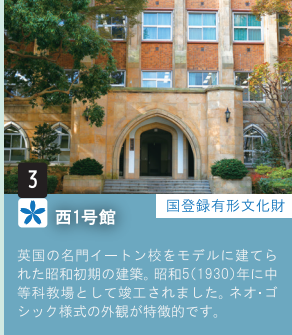
3 西1号館 国登録有形文化財 英国の名門イートン校をモデルに建てられた昭和初期の建築。昭和5(1930)年に中等科教場として竣工されました。ネオ・ゴシック様式の外観が特徴的です。