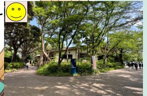
(団体見学)集合場所