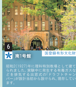
6 南1号館 国登録有形文化財 昭和2(1927)年に理科特別教場として建てられました。実験中に発生する有毒ガスなどを排気する出窓式の「ドラフトチャンバー」が設計当初から設けられ、現存しています。