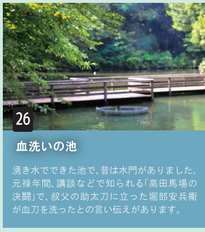
26 血洗いの池 湧き水でできた池で、昔は水門がありました。元禄年間、講談などで知られる「高田馬場の決闘」で、叔父の助太刀に立った堀部安兵衛が血刀を洗ったとの言い伝えがあります。