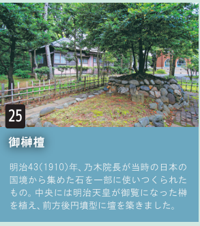
25 御榊壇 明治43(1910)年、乃木院長が当時の日本の国境から集めた石の一部に使いつくられたもの。中央には明治天皇が御覧になった榊を植え、前方後円墳型に壇を築きました。