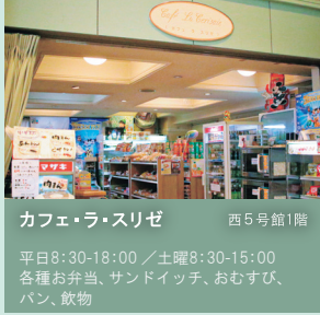
カフェ・ラ・スリゼ 西5号館1階 平日8:30-18:00 / 土曜8:30-15:00 各種お弁当、サンドイッチ、おむすび、パン、飲料