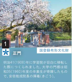
1 正門 国登録有形文化財 明治41(1908)年に学習院が自白に移転した際につくられました。大学の門標は昭和35(1960)年度の卒業生が寄贈したもので、安倍能成院長の揮毫(きこう)。