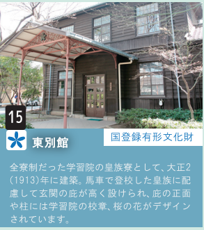
15 東別館 国登録有形文化財 全寮制だった学習院の皇族寮として、大正2(1913)年に建築。馬車で登校した皇族に配慮して玄関の庇が高く設けられ、庇の正面や柱には学習院の校章、桜の花がデザインされています。