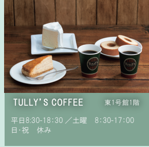
TULLY'S COFFEE 東1号館1階 平日8:30-18:30 / 土曜 8:30-17:00 日・祝 休み