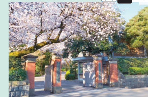
(団体見学)集合場所