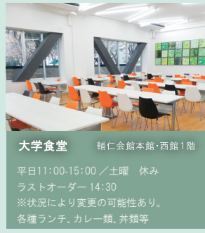
大学食堂 輔仁会館本館・西館1階 平日11:00-15:00 / 土曜 休み ラストオーダー 14:30 ※状況により変更の可能性あり。 各種ランチ、カレー類、丼類等